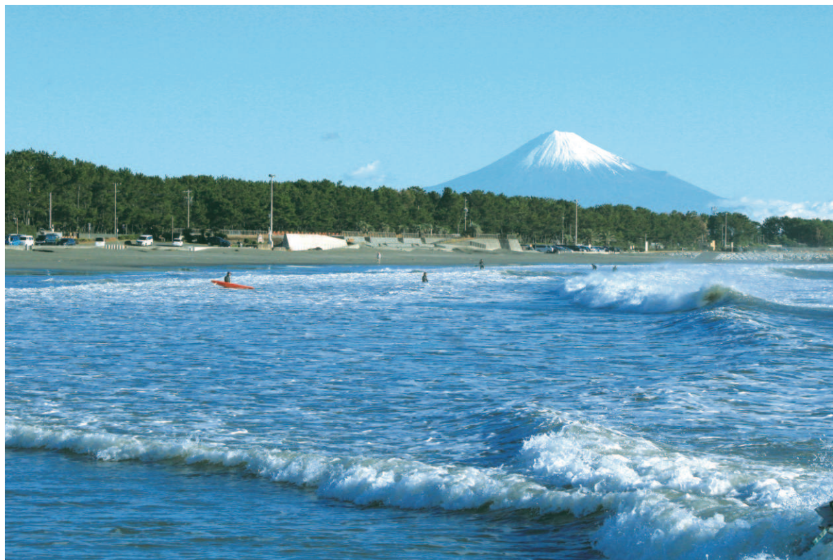
静波海岸と富士山（牧之原市）