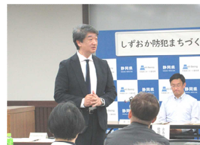
静岡県新聞販売連合会理事長御挨拶 (新規加入団体)

今年度新たに静岡県新聞販売連合会様加入了いただきました。 構成団体・機関数は112団体となりました。