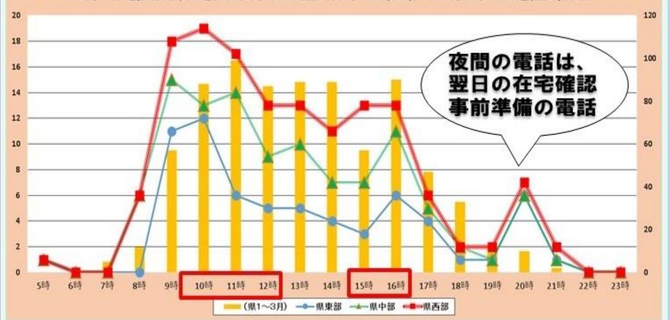
4月サギ電話時間帯入電状況(4月18日時点:棒グラフは県全体1～3月のもの)※速報値手集計