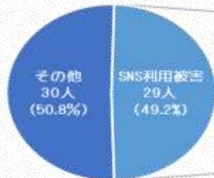
SNS利用による被害(29人中)のアクセス手段の内訳