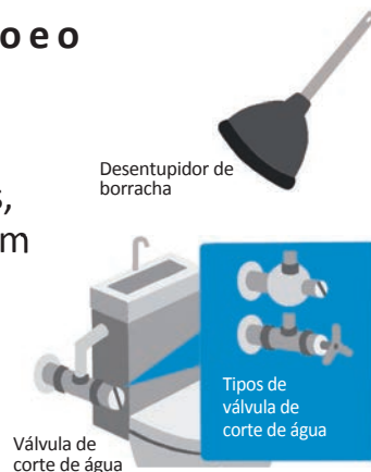
Desentupidor de borracha

Se você fechar a válvula de corte de água no sentido horário com uma moeda ou uma chave de fenda, a água desse tubo vai parar.