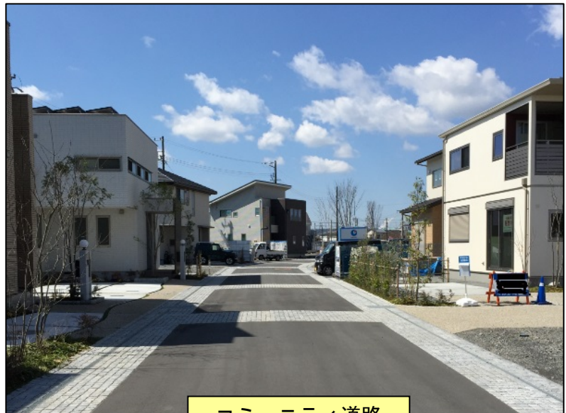
コミュニティ道路