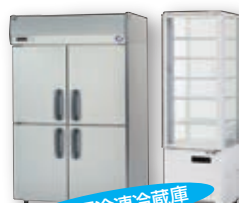
業務用冷凍冷蔵庫