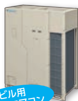
ビル用 マルチエアコン