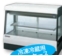
冷凍冷蔵用 ショーケース