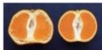
図 うんしゅうみかんの浮皮

お申し込み 裏面申込書によりFAXまたはE-MAILにてお申し込みください お問合せ 静岡県暮らし・環境部環境局環境政策課 まで TEL/054-221-3781 FAX/054-221-2940 E-mail/kankyouseisaku@pref.shizuoka.lg.jp