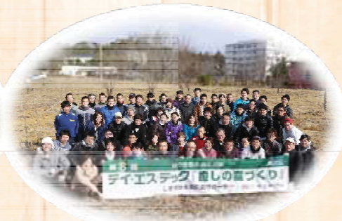
㊦テイ・エステック株式会社