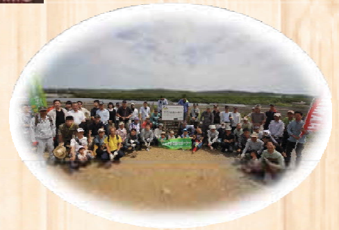
㊦ヤマハモーターパワープロダクツ株式会社