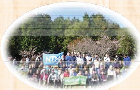
㊦NTN株式会社磐田製作所