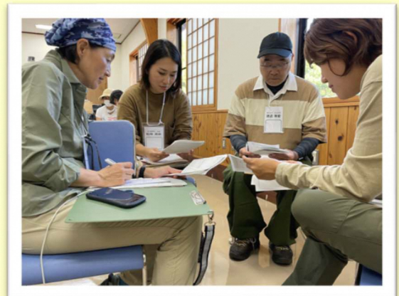
【ふりかえりの様子】

午後は互いに参加者に見立て、組立てたプログラムを実施しました。初めての实習でしたが、どのグループも小道具を使うことや役割分担等の工夫があり、参加者役の受講者も楽しみながら体験をしました。体験後は一人ずつ「良かった点」や「こうするともっと良くなる点」についてフィードバックを行いました。最後にこのフィードバックを参考にしながら、グループで改善点や新しいアイデアについて話し合いを行いました。