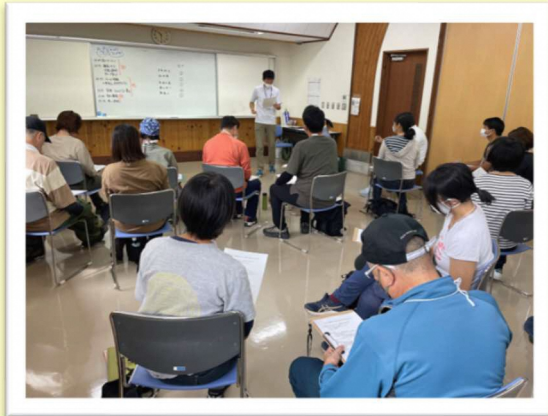
【実習についての講義の様子】

9月24日（日）に榛原郡吉田町にある「静岡県立吉田公園」にて第5回目の養成講座を実施しました。全10回の養成講座も中盤に入り、初めての実習が行われました。今回はグループに分かれ短い体験プログラムを企画し、他のグループの受講者を参加者に見立て実施しました。当日は晴天に恵まれ気持ちの良い環境で行うことができました。