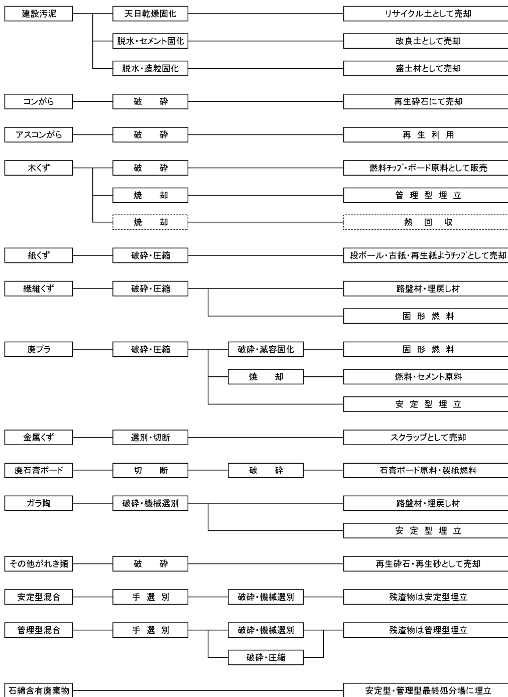
産業廃棄物の一連の処理の工程