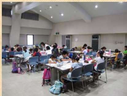
しゅくだいタイム