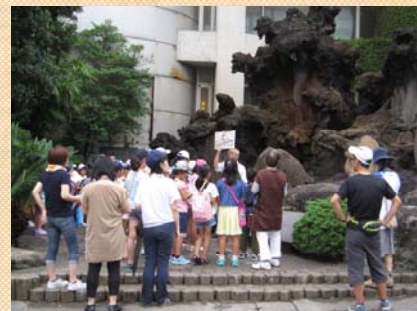
おでかけ (熱海ゆかりの歴史上の人物を勉強中)