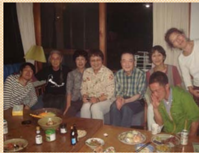
スタッフ・ボランティアの皆さん