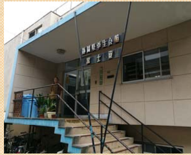
60年の歴史をもつ「静岡県学生会館 富士寮」