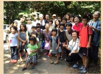
福島の家族とともに