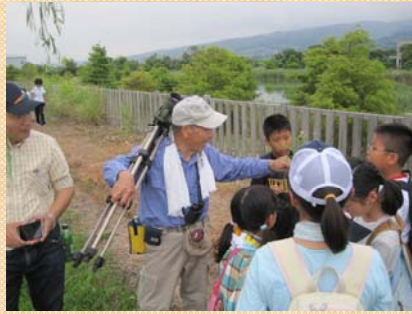
野草のにおいをかいでみます