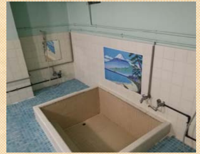
共同風呂には小さいながら富士山が描かれ「静岡県」を感じます