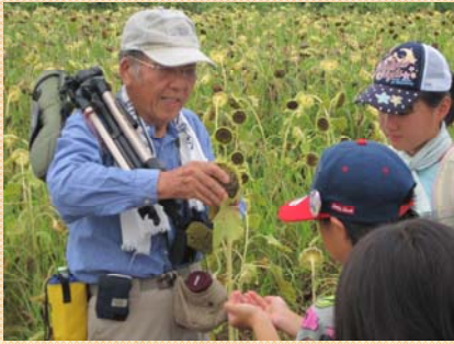
ひまわりのたねを食べてみます