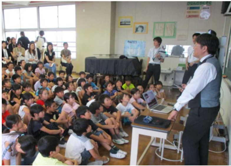
講師の話に聞き入る児童と保護者