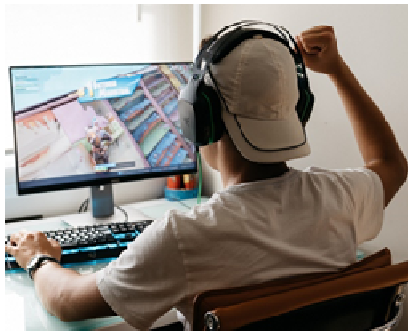
ゲームに依存する若者