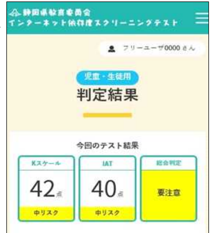
判定画面 (Webシステム)