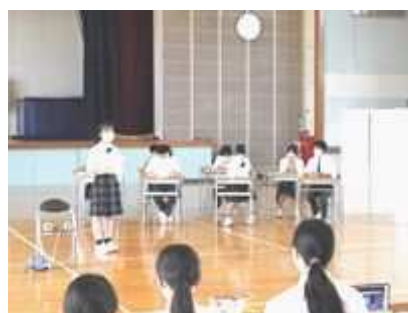
↑ 3年生の演劇練習の様子