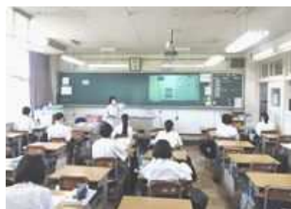
↑ 対面のグループの授業の様子