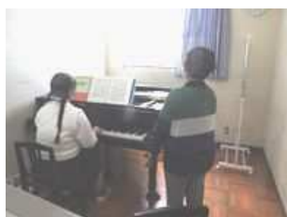
↑ 「芸術科」における個人指導