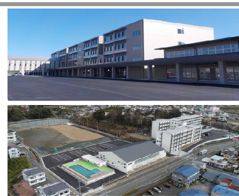
<(上)伊豆の国(下)浜松みをつくし>

県内の知的障害を対象とする特別支援学校の児童生徒数は増加を続けており、今後も引き続き「静岡県立特別支援学校施設整備基本計画」に基づき、計画的に整備を進め、課題解消に努めていく。