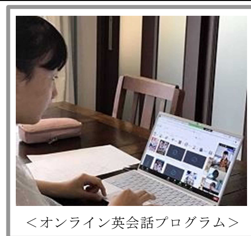
<オンライン英会話プログラム>

受講生はネイティブ講師や他校の高校生との交流により、勉強や将来の留学への関心と自信を高め、事後アンケートでは、ほぼ全員が「スピーキング力、リスニング力が向上した」と回答した。