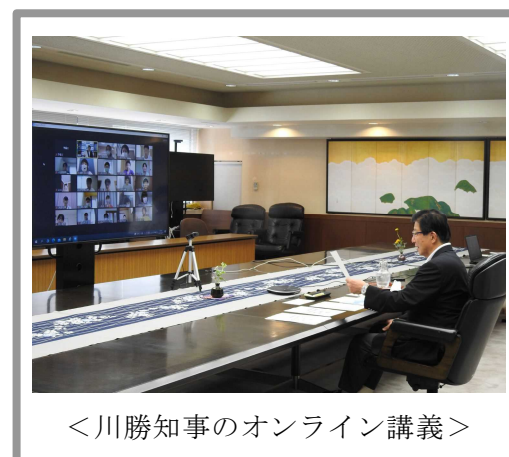
<川勝知事のオンライン講義>

2020 年度は、新型コロナウイルス感染症の感染拡大により中止したが、2021 年度は、一部を除く講義をオンライン形式で 8 月に実施し、一部の講義やグループディスカッション等を 12 月に実施する。また、過去の参加者による近況報告を兼ねた同窓会も 12 月に実施する。なお、2020 年度には、賀茂版 Dream 授業をオンライン開催し、2021 年度も 11 月に開催した。