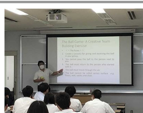
<大学教授による特別授業(大学連携)>

各校の取組の指導や評価のために設置した外部有識者会議等の意見を取り入れながら高等学校の魅力を進めていく。