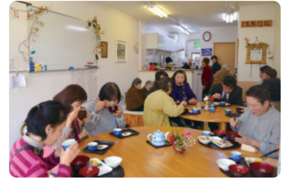
9時のオープン前から常連さんがドア前で待つことも珍しくない「もうひとつの家」。ランチ時は老若男女、市内外の人が訪れとてもにぎやか。コーヒー、お汁粉は100円、袋井のB級グルメ「たまごふわふわ」(300円)もあります。

静岡県で最初の居場所とされるのが「もうひとつの家」。平成11年に助け合い活動の中から居場所を始め、平成21年、JR袋井駅前のビル1階に移転しました。「いつ来ても、いつ帰ってもいい」がコンセプト。駅前という立地、ガラス戸を通して中が見えるオープンな造りのため、高齢者や地域の人だけでなく電車やバスを利用する人、会社員や学生、親子連れも気軽に立ち寄ります。長年培ったネットワークにより提供される新鮮で、安心な食材を使ったランチは300円。決して広くはない「もうひとつの家」。丸テーブルを囲み食事をするうちに隣合わせになった人とも会話が弾みます。奥の畳敷きスペースには常連の高齢者の皆さん。おしゃべりをしたりUNOに興じたり、昼寝をしたりと自由気ままに一日を過ごします。駅前ビルの中にもかかわらず、わが家のごとく過ごせる温かな居場所です。