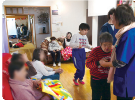
リビングでくつろぐ利用者さん。高齢者さんの「助っ人」も大活躍!

「池ちゃん家」ではデイサービスや短期入所を利用している高齢者が障害のある人をあれこれ世話をしてくれます。同じ敷地に立つ高齢者向けと障害のある人向けの2つのエリアを行ったり来たり。最初はごちなかった高齢者も、時間と場所を共有するうちに慣れてきて、声をかけたり見守ったりする役割にやりがいを感じてくれるようになりました。平成25年から障害のある人向け短期入所が始まり、スタッフも夜間は高齢者・障害のある人の両方をみるようになって、利用者の情報を共有できるようになりました。民家をそのまま使った施設は、アットホームな雰囲気、地域の方がボランティアでフラダンスや踊りを披露し、利用者を巻き込んで踊ったり歌ったり。「池ちゃん家」は利用者、スタッフ、地域のボランティア団体、ジョブコーチなど様々な人が関わることで、今日もにぎわっています。