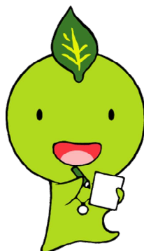
生きがいと健康づくりイメージキャラクター 「ちゃっぴー」