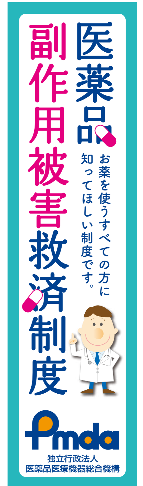
④ワイドスカイスクレイパー / 左右 160pix × 天地 600pix