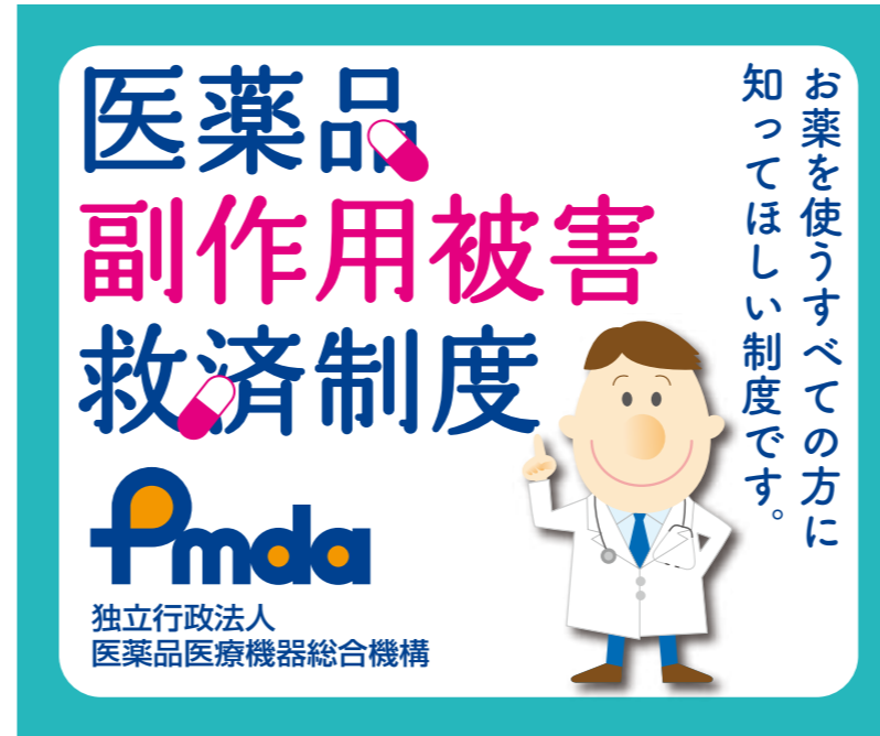
⑤レクタングル / 左右 300pix × 天地 250pix