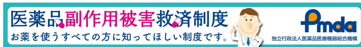
②バナー / 左右 468pix × 天地 60pix