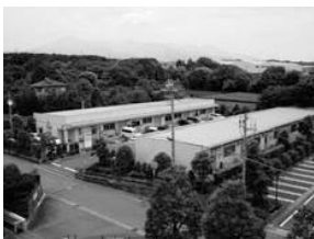
▲富士インキュベートセンター