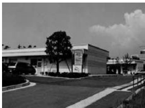
▲沼津インキュベートセンター