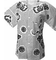
▲「焼津魚河岸シャツ」