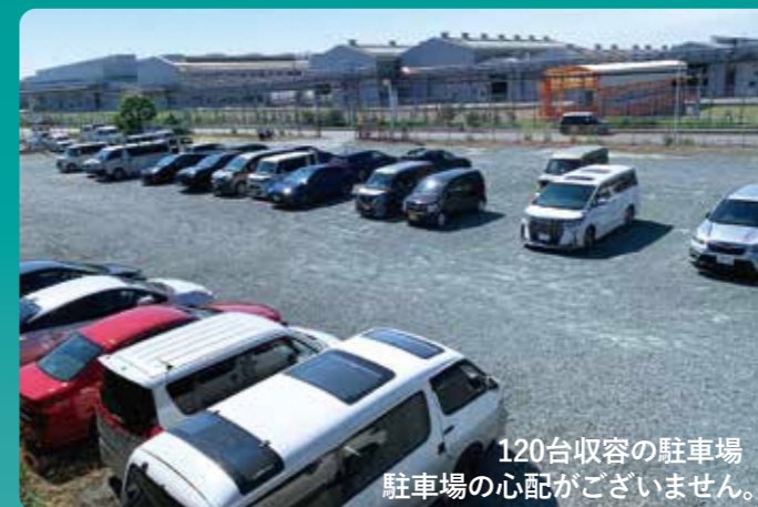
120台収容の駐車場 駐車場の心配がございません。

浜松労政会館は、勤労者福祉のための施設です。勤労者をはじめ、企業・団体・サークル等の会議や研修の場としてお気軽にご利用いただける施設です。