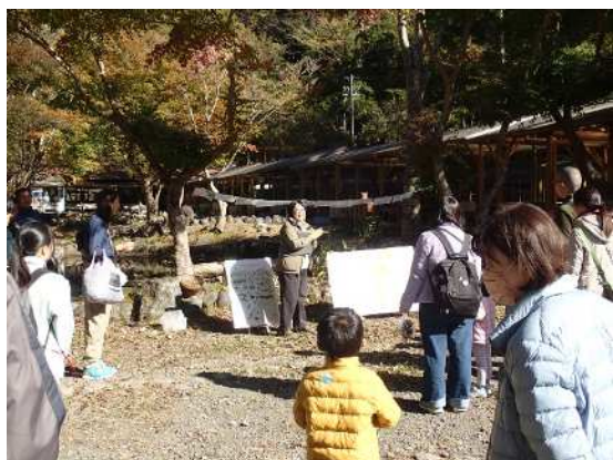
山本委員からまとめ