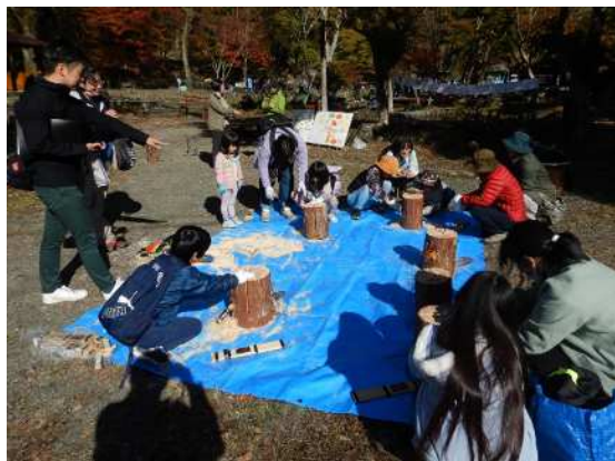
クラフト体験中に意見収集①