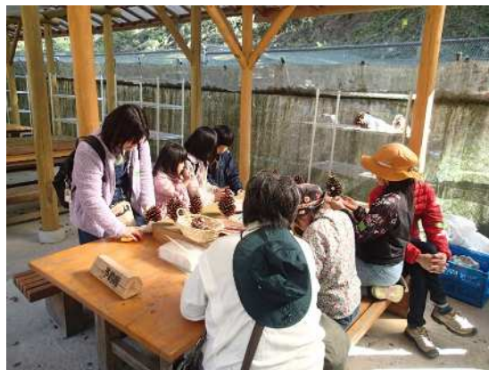
クラフト体験中に意見収集②