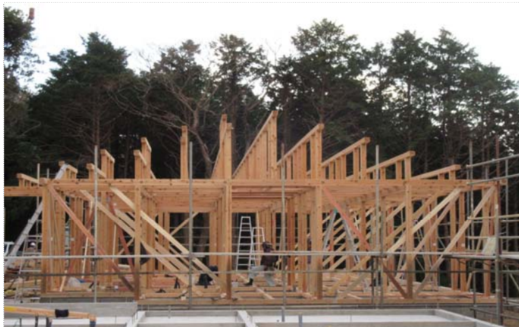
【外観】柱・梁・母屋・棟木・大引等の構造材に県産材を使用。