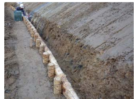
【施工状況】設置状況