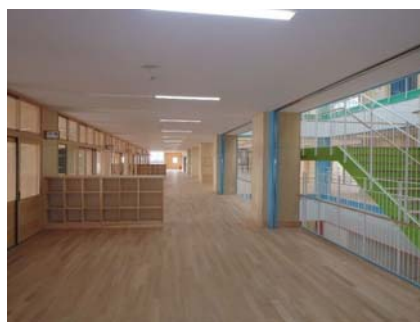
【校舎】廊下の下地材・内装材に県産材を使用