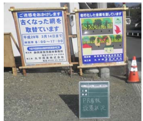
【施工状況】 工事PR看板設置