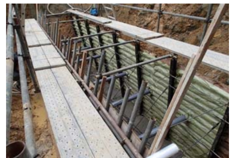
間伐材取付状況(土留工)