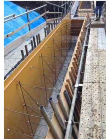
右岸側からの型枠内部状況