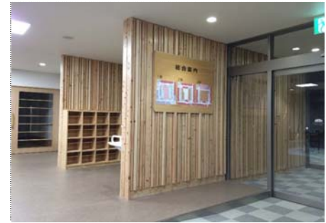
【エントランスホール】