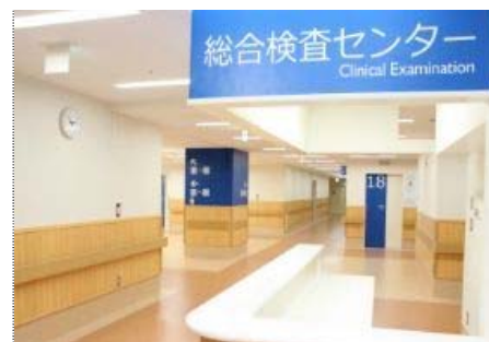
【2階 総合検査センター受付】