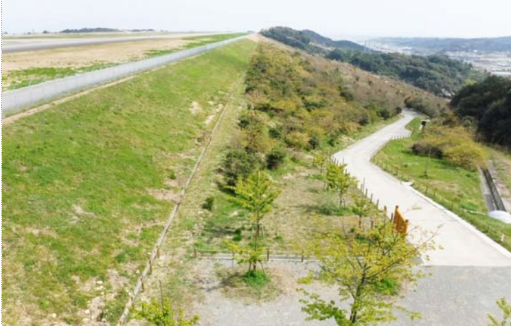
木製ロープ柵全景