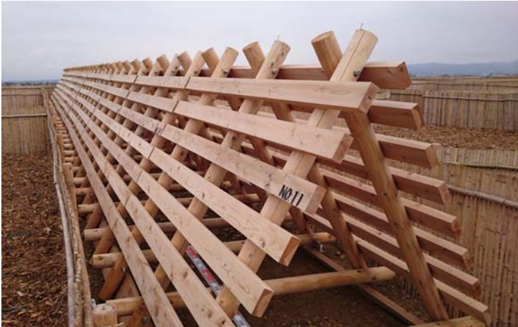
【防風工(丸棒・端太角)】