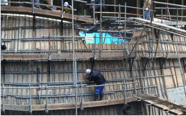
下流側からの型枠設置状況