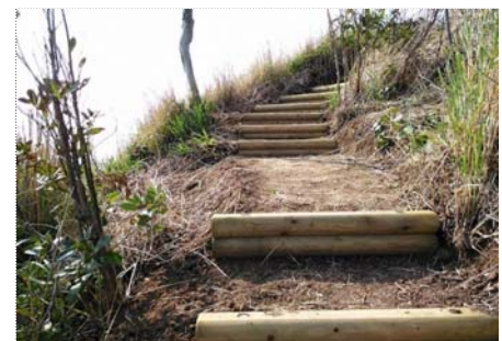
【遊歩道】 丸太階段工