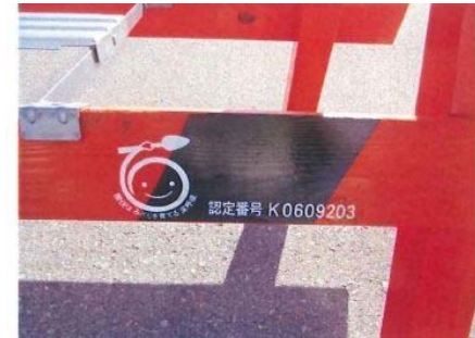
【写真】 間伐材マーク