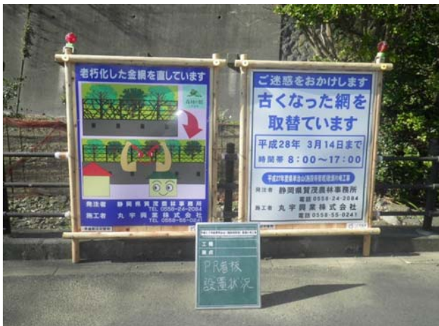
【工事PR看板】 治山工事の内容等をわかりやすく表示し、地域住民に工事の周知を図った。