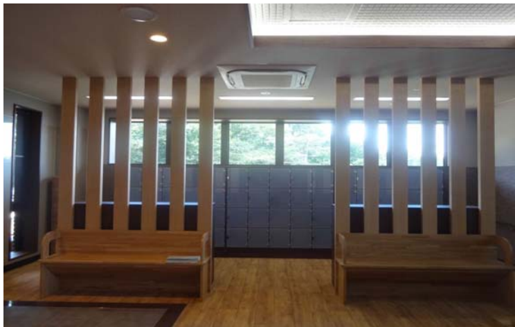
【エントランスコーナー】 集成材のベンチを設置