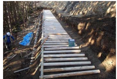
【施工状況】杭木敷設