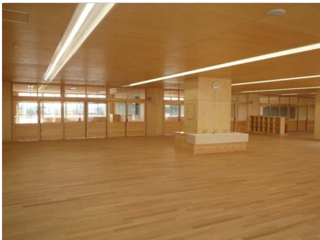
【校舎】オープンスペースの下地材・内装材に県産材を使用