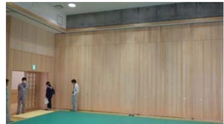
【体力測定室】内装:天竜材ヒノキ