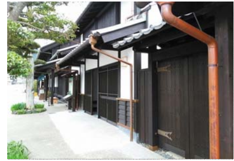
【案内所】町並み再現