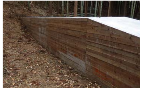
【谷止工完成時】平割材残存