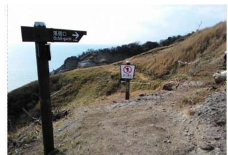
【標識】 誘導標識、注意標識