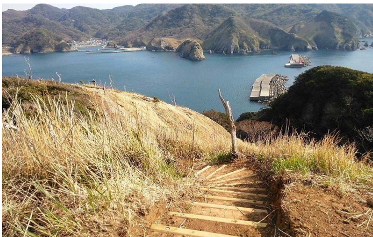
【遊歩道】 丸太階段工