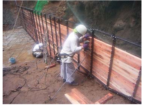
【施工状況】カチオンフレーム組立