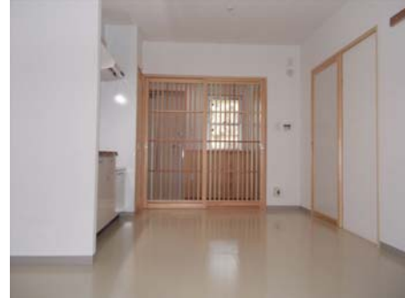
【ダイニングキッチン】 建具、建具枠に県産材を使用