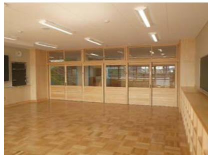
【校舎】教室の下地材・内装材や建具に県産材を使用