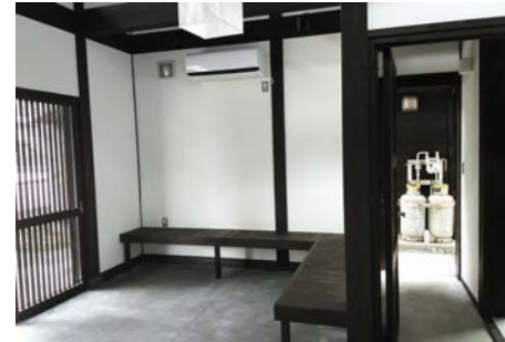
【案内所】案内所内部(休憩所)