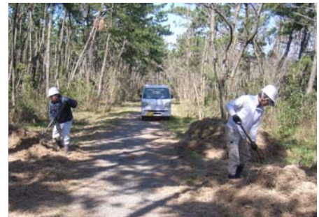
【チップ敷設(マルチング材)】