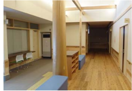
建物内観(エントランスホール)