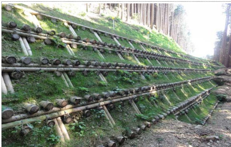
【全景】法面緑化により景観的調和を図ることができる。