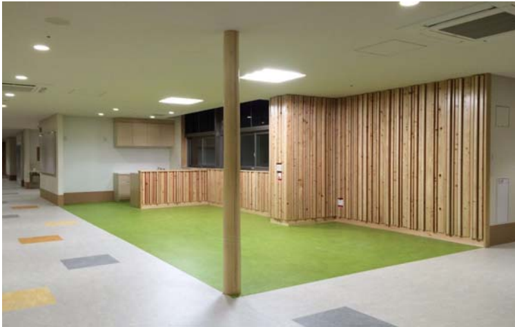
【入所者交流スペース】 地場産である“富士ひのき”を使用し温かみのある空間となっている