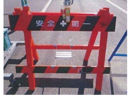
【写真】 木製バリケード