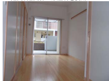
【洋室】 フローリング、建具枠に県産材を使用