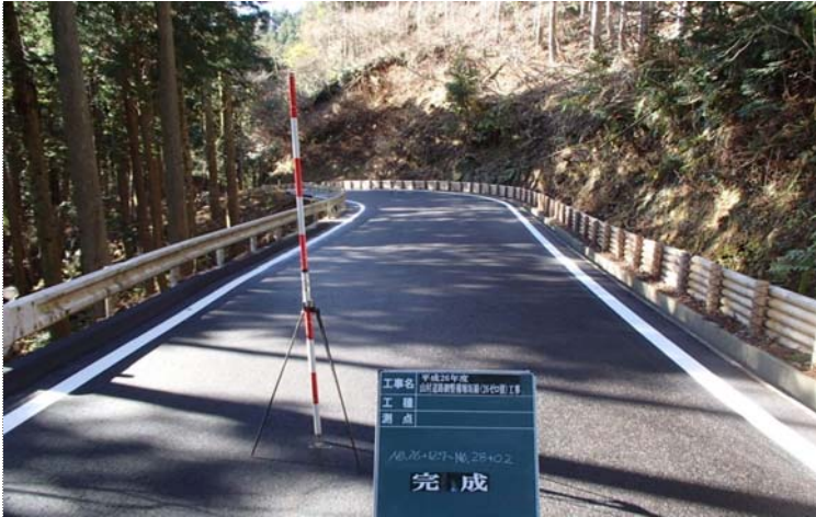
【木柵工】土砂流出の防止と早期の緑化環境を整える。