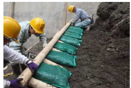
【施工状況】横木、植生土のう設置