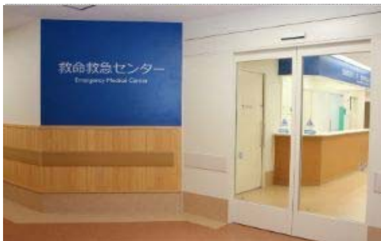
【1階 救命救急センター受付】腰壁に県産材ヒノキを使用