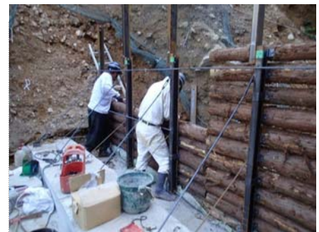
間伐材取り付け状況(谷止工)