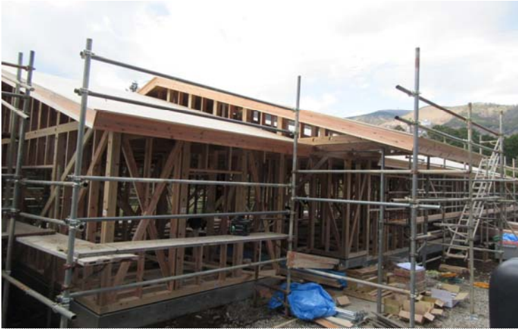
【外観】柱・梁・母屋・棟木・大引等の構造材に県産材を使用。