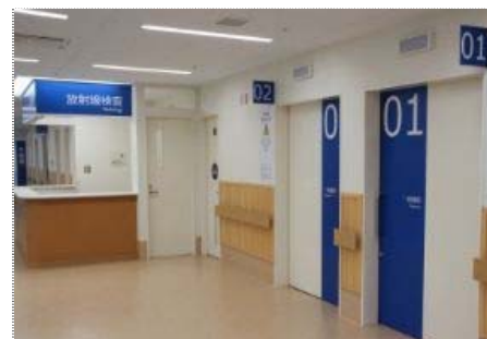
【1階 放射線検査受付】