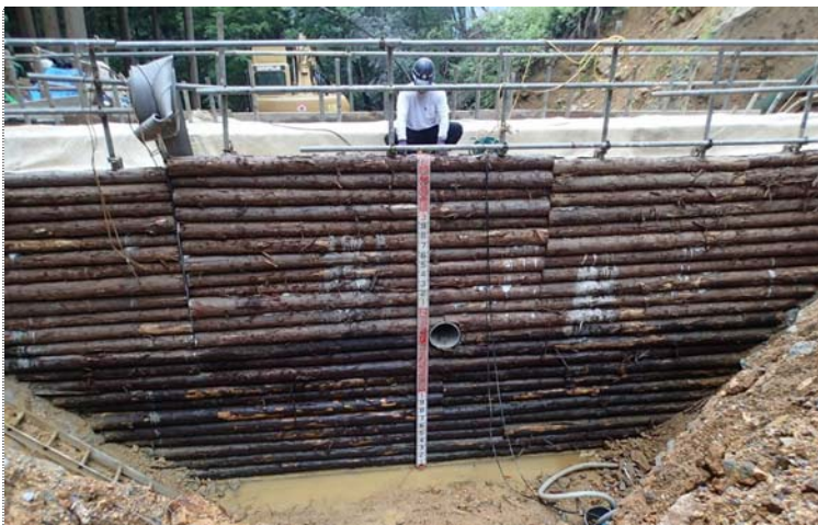
施工後全景(谷止工)