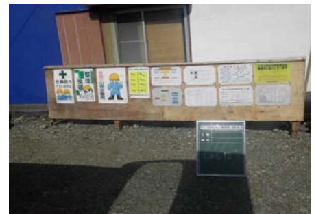
【施工状況】 工事書類掲示看板設置