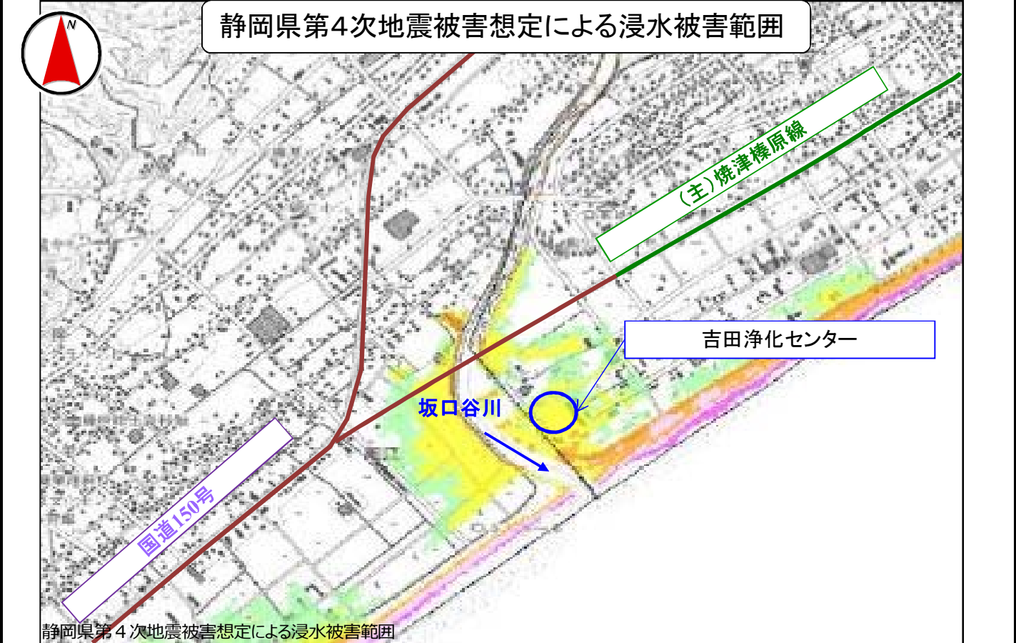
静岡県第4次地震被害想定による浸水被害範囲