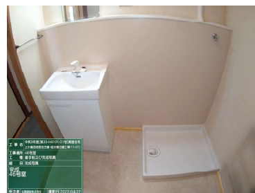
洗面所、洗濯機置場