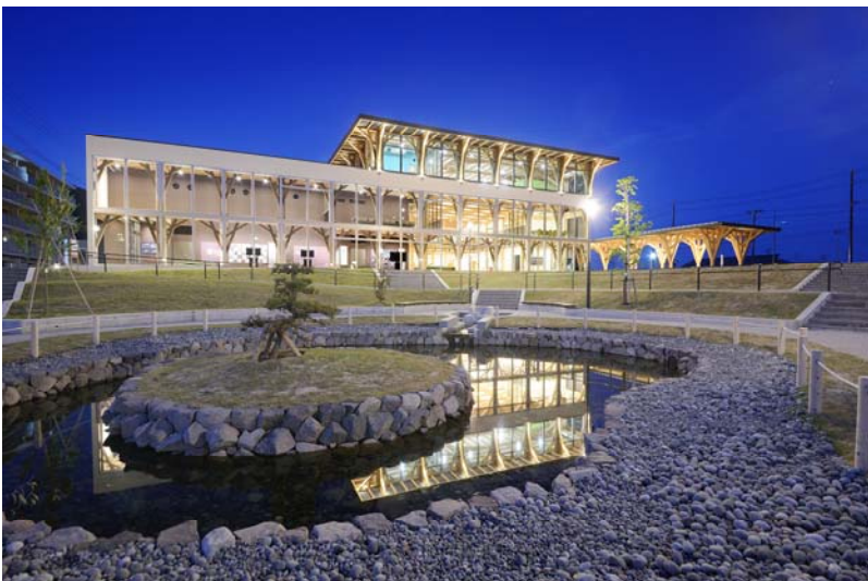
[写真：大槌文化交流センター]

日時：平成30年11月22日（木）13:30～16:50 [13:00より受付]