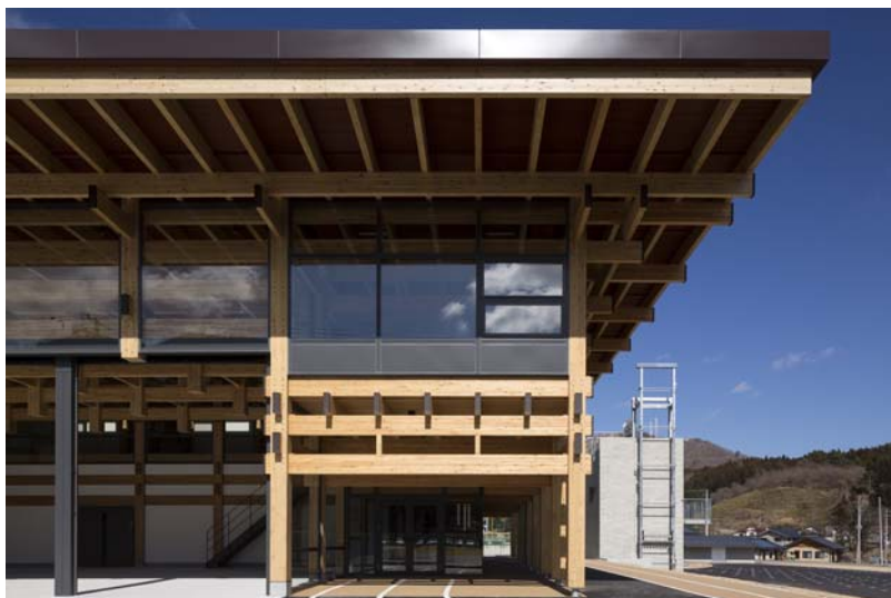
[写真：大船渡消防署住田分署]

群馬県農業技術センター、陸前高田市高田東中学校、 TIMBERED TERRACE(石川県小松市)、 大船渡消防署住田分署