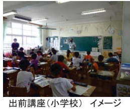
出前講座(小学校) イメージ