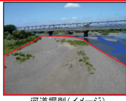
河道掘削(イメージ)