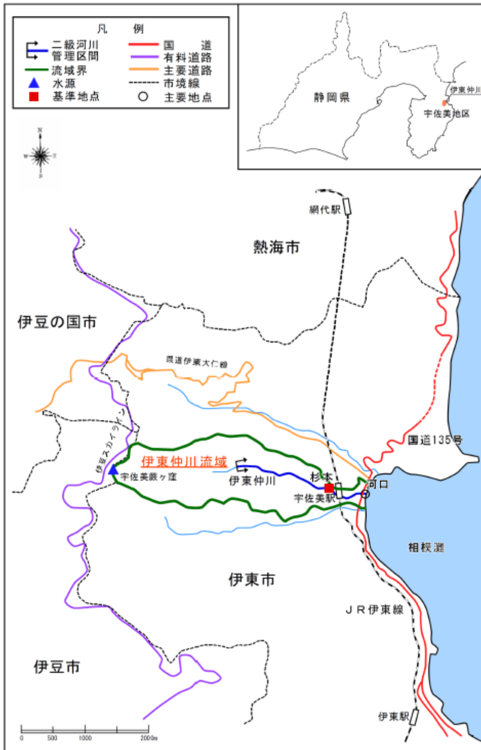
(参考図) 伊東仲川水系図