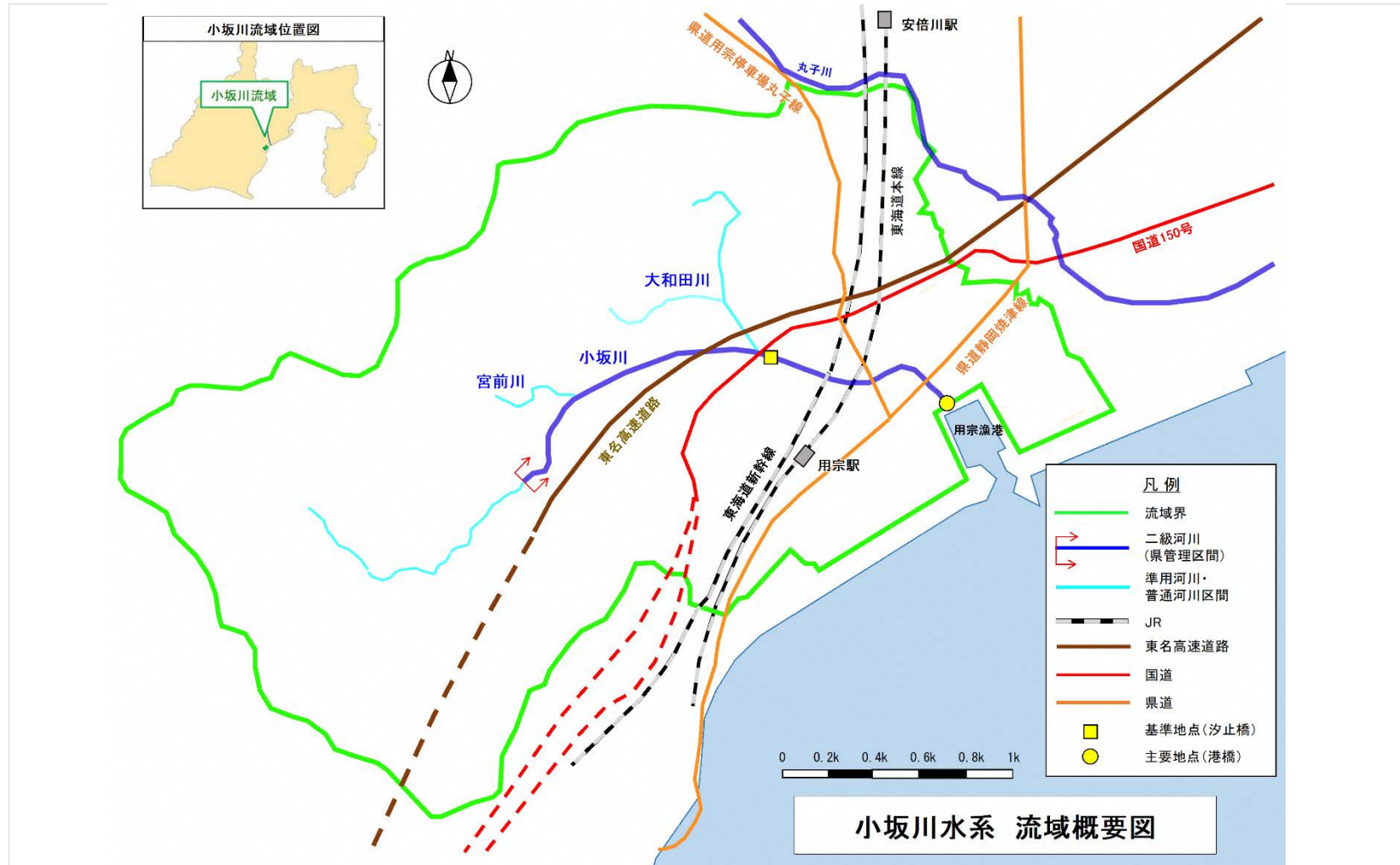
(参考図) 小坂川水系図