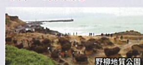
野柳地質公園 野柳地質公園は荒々しい海を背景に、自然が作り出した独特な地形や無数の奇岩が広がる景色をお楽しみいただけます。九份は数々の映画の舞台となり、細く長い石畳の道沿いに小さな建物が軒を連ねる素朴なこの村の風景をお楽しみください。

(詳細) ●歩く度: ( ) ●所要時間: 約5時間 ●食事: なし ●行程: 野柳(約80分) / 九份(約80分)