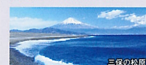
三保の松原 世界文化遺産「三保の松原」と名勝「日本平」の2つの異なる眺望をお楽しみいただけます。「日本平」と「久能山東照宮」間は、絶壁の屏風谷(びょうぶだに)や駿河湾を眺めながらロープウェイにて移動致します。

(詳細) ●歩く度: ( ) ●所要時間: 約4時間45分 ●食事: なし ●行程: 三保の松原(約60分) / 久能山東照宮(約100分) / 日本平(約30分)