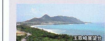
玉取崎展望台 石垣島の観光名所を効率よく回ることができます。昼食は、古民家「舟蔵の里」にて八重山料理をお楽しみいただけます。

(詳細) ●歩く度: ( ) ●所要時間: 約6時間5分 ●食事: なし ●行程: 玉取崎展望台(約40分) / 米原(よねはら)ヤエヤマヤシ群落(約40分) / 川平湾(約30分) / お土産屋(琉球真珠)(約10分) / 昼食(舟蔵の里)(約90分)