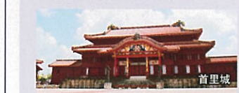
首里城 2つの世界遺産「首里城」と「識名園」の入場券付です。国際通りでは、ショッピングや自由散策をお楽しみいただけます。昼食は、伝統の沖縄料理をお召し上がりください。

(詳細) ●歩く度: ( ) ●所要時間: 約6時間25分 ●食事: あり ●行程: 識名園(約40分) / 星食(四つ竹)(約60分) / 首里城(約70分) / 国際通り(約80分)