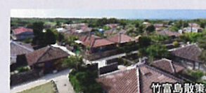
竹富島散策 竹富島の歴史ある町並みを南国情緒あふれる水牛車でご案内致します。石垣島唯一の石垣島商店街(ユウグレナモール)では、様々なお店でショッピングやお食事をお楽しみいただけます。

(詳細) ●歩く度: ( ) ●所要時間: 未定 ●食事: なし ●行程: 竹富島観光(未定) / 石垣島商店街(ユウグレナモール)(未定)