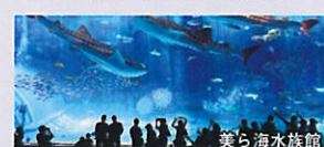
美ら海水族館 沖縄美ら海水族館では、沖縄の海の生き物、美しい景色を満喫していただけます。沖縄美ら海水族館は入場券付です。昼食は100年の歴史を刻む古民家「大家」にて沖縄料理をお召し上がりいただけます。

(詳細) ●歩く度: ( ) ●所要時間: 約7時間 ●食事: あり ●行程: 昼食(大家(うふやー))(約60分) / 美ら海水族館(約80分) / 古宇利大橋(約20分)