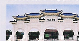
2006年にリニューアルされた故宮博物院。世界4大博物館の一つと言われており、歴史的文化遺産が収蔵されています。人気の定番スポット忠烈祠を見学します。その後、お土産屋にも立ち寄ります。

(詳細) ●歩く度: ( ) ●所要時間: 約4時間45分 ●食事: なし ●行程: 故宮博物院(約110分) / 忠烈祠(約40分) / お土産屋(約35分)