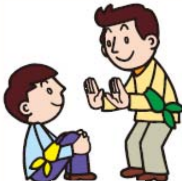
ま 待つ Wait