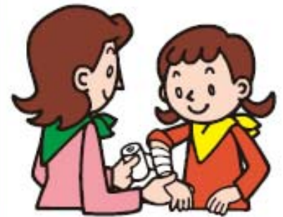
てあ 手当て Care