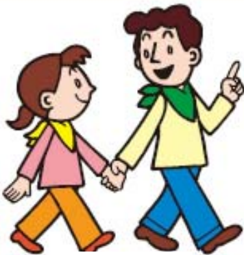
いどう 移動する Move