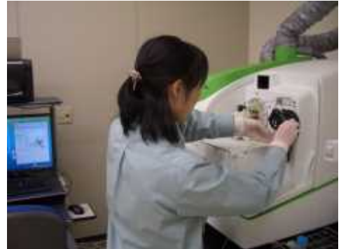
水質検査（金属類の一斉分析）

水質検査は、法定検査である毎日検査項目と月1回の水質基準項目・管理目標設定項目について水質の安全を確認する検査と、結果を薬品注入や浄水操作に反映させ、より良い水を作るため毎週行う検査があります。水道水の安全の要とも言える業務です。