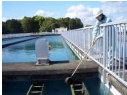
浄水工程の水質検査用の採水