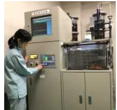
原水水質監視装置の保守作業