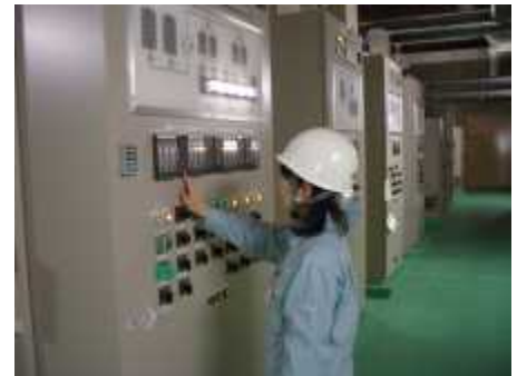
薬品注入設備の点検

設備や浄水工程のトラブルは症状も原因も様々で、複数の要素が重なっている場合も多く、時間的制約がある場合もあります。それらを解明して素早く対処できるようにするため、日頃から設備や工程が水質にどう影響するかを考えるようにしています。