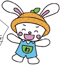
静岡県幼児教育推進 マスコットキャラクター 「わっ！びよん」

園の先生と小学校の先生が、共に学び、語り合うことで、幼児教育と小学校教育の相互理解を深めることができる研修会だよ！