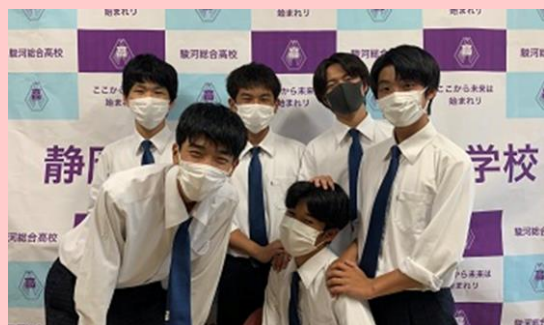
有志団体 US (静岡県立駿河総合高等学校) (静岡市駿河区)

駿河総合高等学校の生徒6人のメンバーで、「地域貢献」をキーワードに災害支援活動等に取り組んでいる。授業で学んだSDGsの知識を生かし、企業と協力し独自性のある活動を継続。幅広い年齢層に対応した活動は、地域の人々から大変喜ばれている。