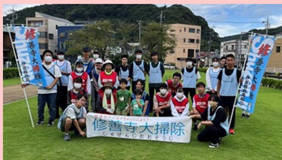
静岡県立伊豆総合高等学校 生徒会 (伊豆市)

生徒会が主体となり、10年以上にわたり毎月の地域の清掃活動を継続。地域の高齢者から子どもまで幅広い年齢層の人々が清掃活動に参加し、地域住民が交流する機会となっている。清掃活動を通し、明るく住みやすい地域作りに貢献している。