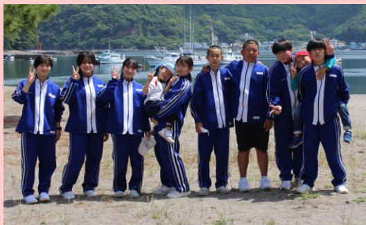
沼津市立戸田小中一貫学校 自治会 (沼津市)

学校自治会が主体となり、御浜岬の海岸美化活動を継続。地域の環境美化委員やこども園などと一緒に活動し、学校と地域の連携強化にもつながっている。観光スポットの清掃活動を行うことで子どもたちの郷土愛を育てる活動となっている。