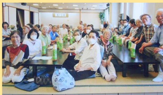
シニアクラブ江尻 (静岡市清水区)

学校教育に長年携わり、子どもたちの教育活動の推進を支えている。また、コミュニティ・スクールでは学校と地域をつなげる橋渡し役を担っている。児童の地域学習の際には、地域の知識を伝え、安全を見守るなど学校に無くてはならない存在である。