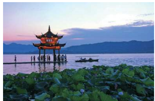
西湖（浙江省杭州市）