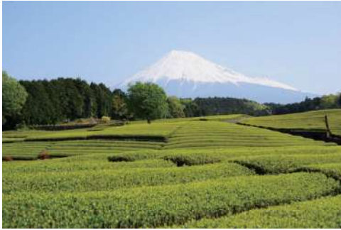
大淵笹場（静岡県富士市）