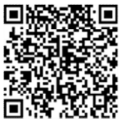
採用試験お知らせページ