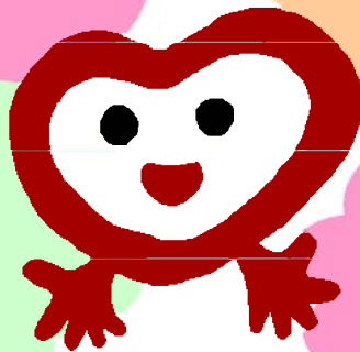
静岡県献血イメージキャラクター 「アボちゃん」