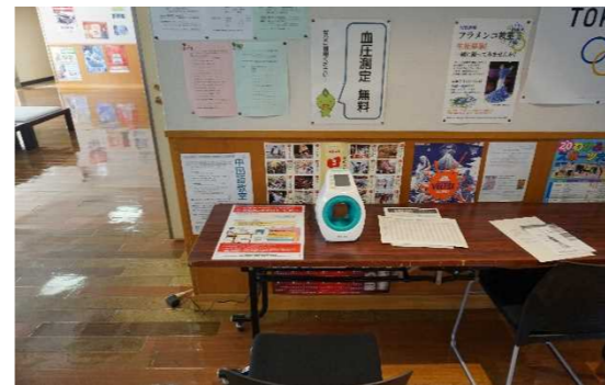
⑵9 サンワーク(下田市)