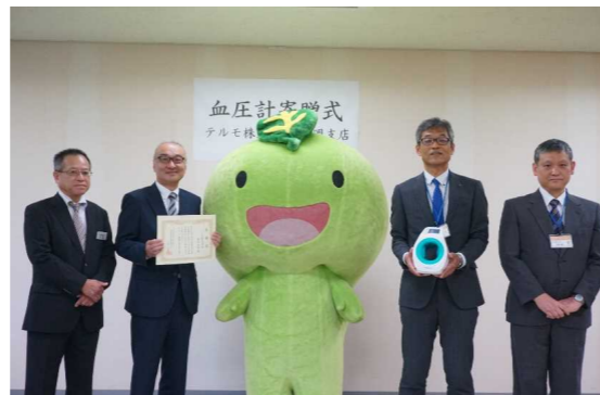
令和元年9月25日 テルモ(株)静岡支店様 血圧計寄贈の様子