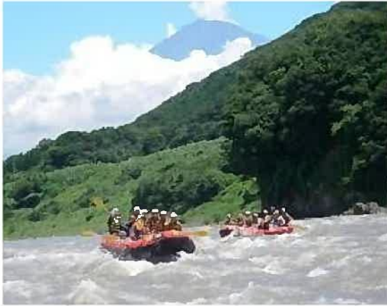
富士川(芝川)でのラフティング