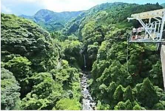
林道橋上のジャンプ台と須津川溪谷