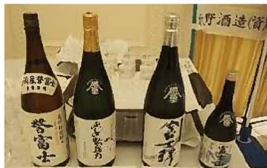
誉富士：左から富士高砂酒造「誉富士純米」、富士正酒造「純米吟醸ふじのみや強力」、牧野酒造「純米吟醸 誉富士富士山」、富士錦酒造「富士錦 特別純米ほまれふじ」

静岡県農林技術研究所で開発した酒造好適米「誉富士」を使用し、酒蔵ごと味わいの違う、バラエティーに富んだ酒造りに取り組んでいます。