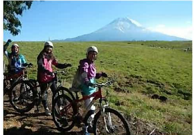
朝霧高原でのマウンテンバイク