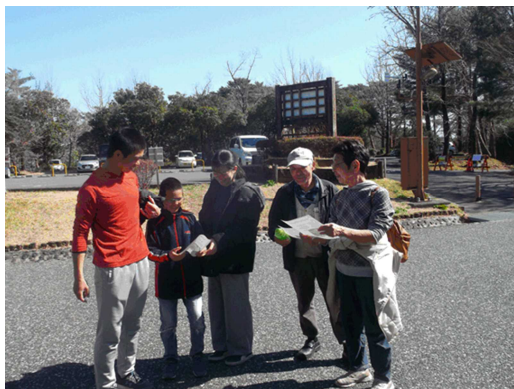
森林散策で訪れた家族へ チラシ配布