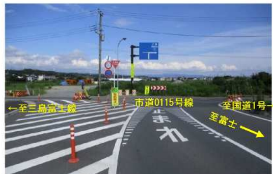
計画区間状況(終点より起点を望む)