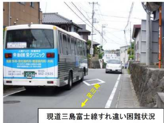
現道三島富士線すれ違い困難状況