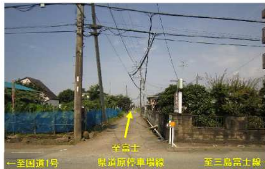
計画区間状況(起点より終点を望む)