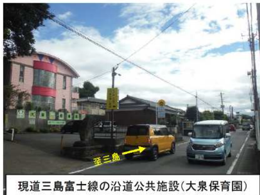
現道三島富士線の沿道公共施設(大泉保育園)