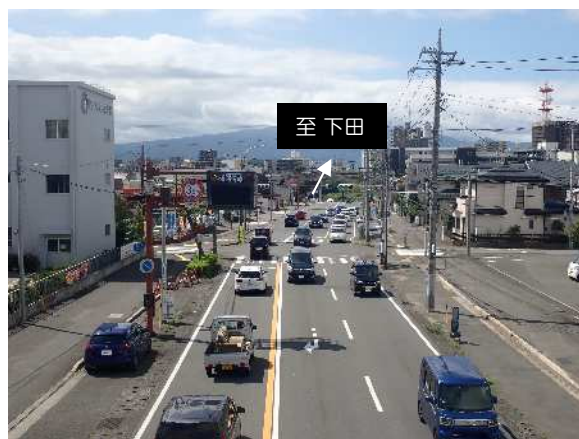
現況写真（南側工区）