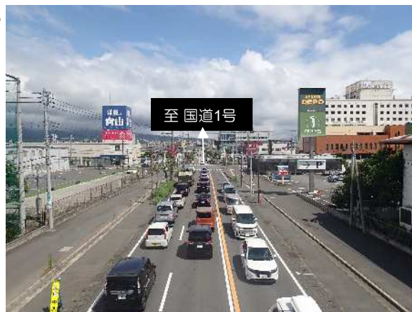
現況写真（北側工区）