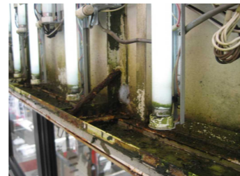
↑内照式看板内部の腐食、部材の腐食器具の劣化による出火の恐れも。