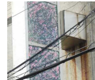
←ブラケット下に汚ダレが見られると、内部の取付金具にサビや腐食の可能性もある。