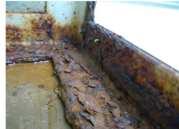
↑看板面（アクリル板）のひび、割れ、ゆがみ板面の落下により、内部に水が入り腐食する原因に。