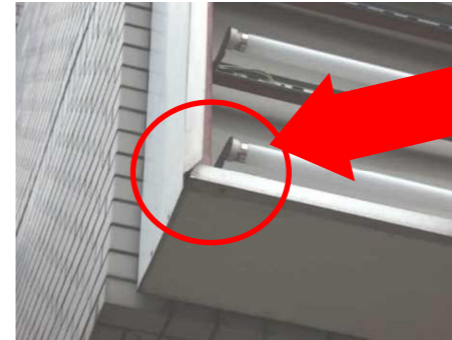
←パネルの変形、ズレ、破損の他、パネルの押さえ枠が変形し落下する場合も。

表示パネルの四方を押さえ枠で固定する欄間看板。複数枚のパネルを使用する場合は、隣り合うパネル同士をきちんと固定しないと、振動や風などで落下する恐れがあります。