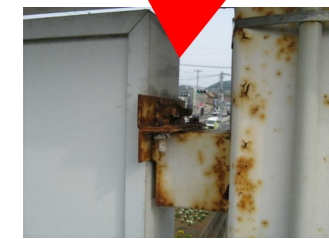
←取付金具のサビや腐食。ボルトやビス等が欠落していたら緊急の対応が必要。放置すると看板が落下する恐れも。