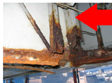
↑板面裏側のサビ、腐食。サビによる腐食はミルフィーユ状に剥がれ崩落する恐れも。