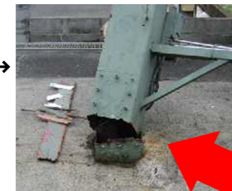
折れた柱の根元。点検口のボルト穴からサビが入り腐食して、鉄骨が破断した。

交通の激しい沿道で看板の柱が折れたが、隣地の看板が支えとなり、道路への倒壊を免れた事故。電線を切断すると停電による損害賠償額は膨大な金額になることも。