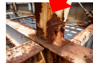
↑内部鉄骨のサビ・腐食。