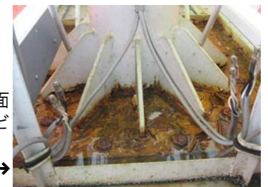
看板の根元がカバーで覆われている場合、表面はきれいでも内部でサビが進行している恐れも。