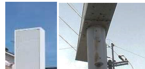
↑看板本体からポールへの汚ダレがあると、接合部にサビや腐食が進行する恐れ。