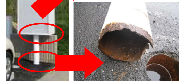
↑柱根元のサビを放置し、倒壊。