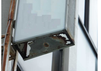
↑看板底部の留め具が壊れるとアクリル板が抜け落ちる原因にも。