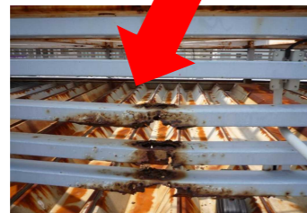
↑目隠しルーバーのサビ・腐食。