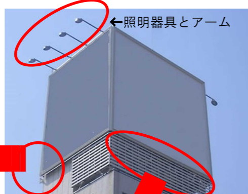
←照明器具とアーム

外照式の屋上看板では照明器具のアーム接合部の腐食やボルトのゆるみがあると器具が落下する恐れがあります。