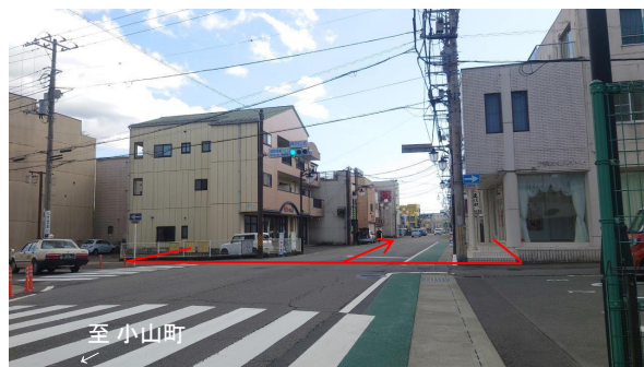
【終点部から起点を望む】