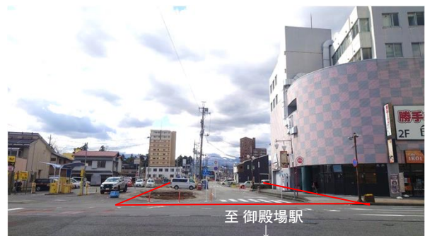
【起点部から終点を望む】