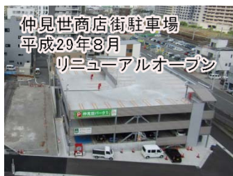
仲見世商店街駐車場 平成29年8月 リニューアルオープン