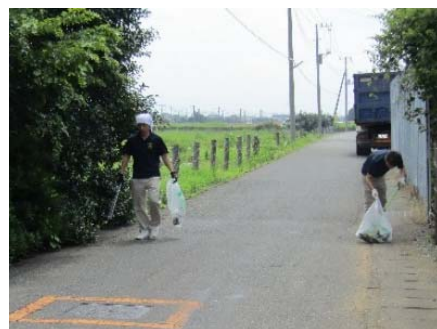
ゴミ拾いの様子 (新貨物ターミナル用地周辺)