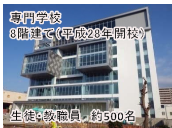
専門学校 8階建て(平成28年開校)

今後も、鉄道の高架化で生み出される鉄道施設の跡地や高架下などを有効活用し、さらに民間投資が活発になり、広域拠点都市「沼津」の魅力とにぎわいが一段と高まるように、沼津駅周辺総合整備事業を進めてまいります。