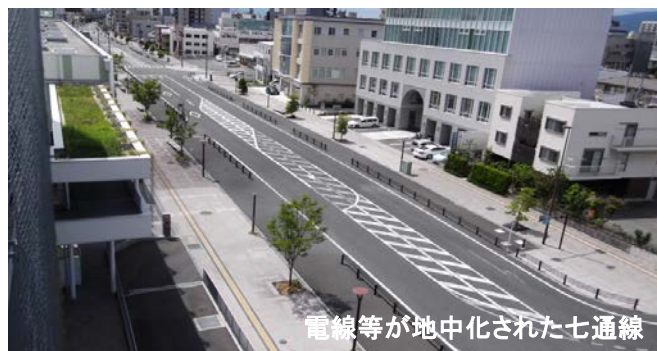
電線等が地中化された七通線

道路の整備に合わせて電線等を地中化することにより、災害時の電柱倒壊や電線切断を防止し、避難経路や緊急車両の通行を確保します。また、地震による電力や通信回線などライフラインの被害を軽減できます。