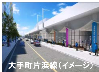
大手町片浜線(イメージ)

道路や公園を整備することにより、地震発生時における避難路・輸送路としての機能や避難地としての機能、火災発生時における延焼遮断機能等を向上させ、防災機能を強化します。