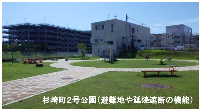
杉崎町2号公園(避難地や延焼遮断の機能)