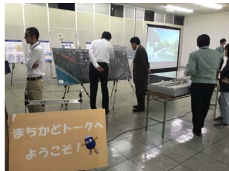
沼津商連会館ビル ギャラリーぶらざ パネルと模型は常時展示中