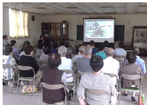
片浜地区で実施した出前講座(平成28年6月)