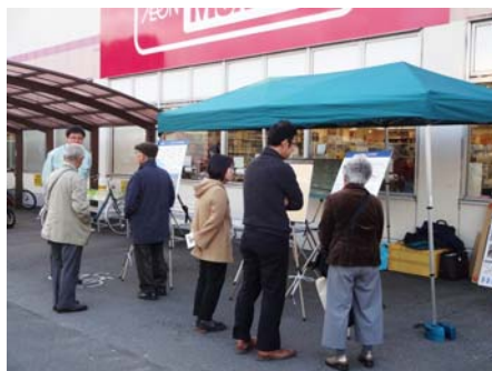
マックスバリュエクスプレス 沼津原町西店