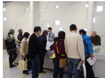
プラサヴェルデ キラメッセぬまづ パネルと模型は常時展示中