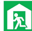
ひなんじょ 避難所

避難した住民等を災害の危険性がなくなるまで必要な期間滞在させ、又は災害により家に戻れなくなった住民等を一時的に滞在させることを目的とした施設。