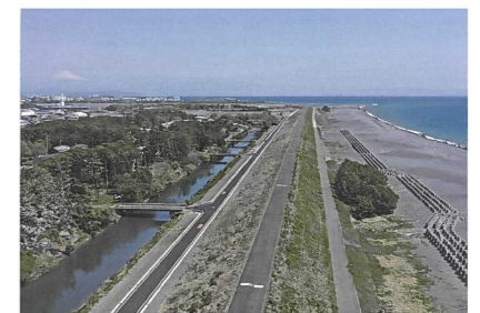
吉田町における静岡モデル防潮堤【川尻防潮堤】

※1 レベル1の津波：発生頻度が比較的高く、発生すれば被害をもたらす。 ※2 レベル1を超える津波に対しても、施設による被害の最小化を図るため、地域住民の合意を得て、海岸堤防の背後盛土等を行うもの。