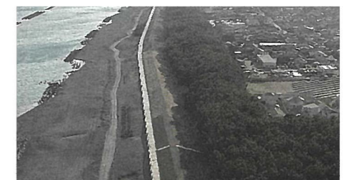
焼津市における静岡モデル防潮堤【潮風グリーンウォーク】