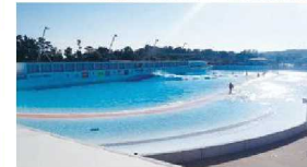
静波サーフスタジアム PerfectSwell®