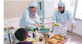
カタショー・ワンラボ(牧之原市)