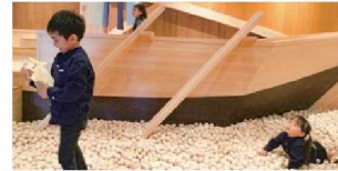
ターントクルこども館(焼津市)